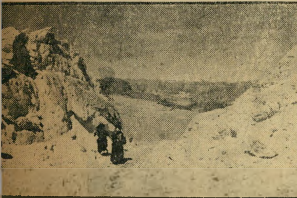
נוף מדבר נכלל גם הוא בין צלומיו האחרונים של דן גלעד. בסיוריו לא צייל דן מעולם אנשים או פרופוסים. מצלמתו היתה המחוסן בו אגר את רשמיו הנופים בהם עבר.