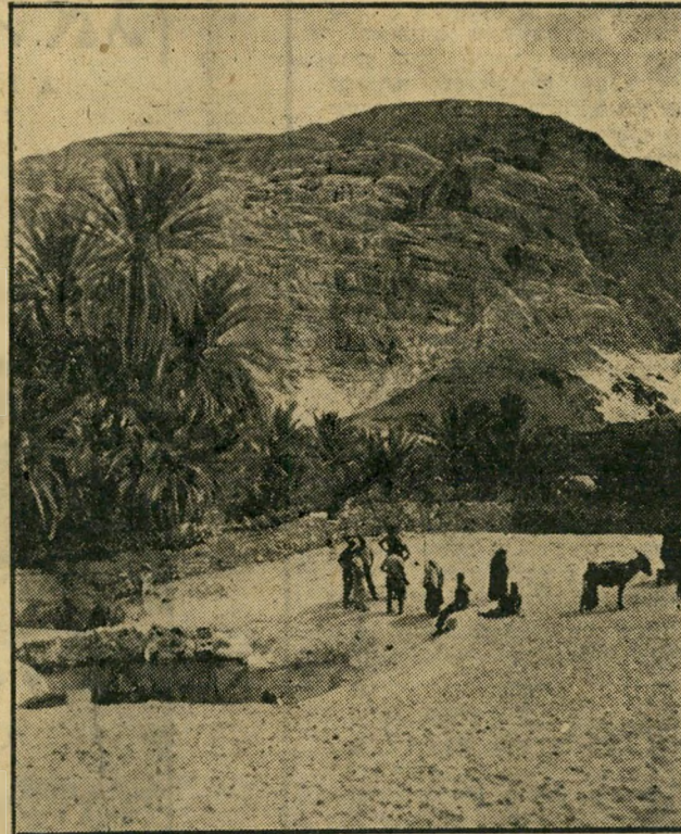
פגישה עם ערבים. תמונה נוספת מטרת הצלומים האחרון במצלמתו של דן גלעד. מראה את אנשי הסיור לקדש ברנע בהברת מספר ערבות מהכפר קטיימה, שבאו לשאוב מים ממעינות נוה המדבר.