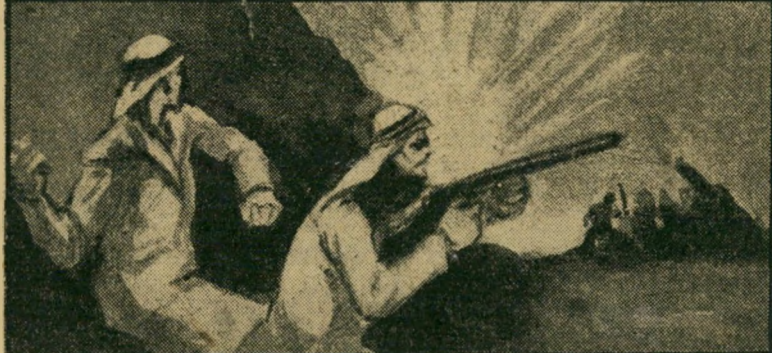
שתי תמונות תעמולה ערביות, המתארות את התקופה המוזכרת בספרו של קירקבריד. בעליונה: סטס הכרות עצמאות ירדן. בשניה: שני לוחמים ערביים בפעולה.

אלק קירקבריד עזב את אנגליה מוזדנתו בגיל תשע, כאשר עברה משפחתו למצרים. הוא עזב את המוזזב כעבור 50 שנה, כאשר התפטר מתפקידו כשגריר בריטניה בלוב, ב-1955. עם פרוץ מלחמת העולם הראשונה, היה אחד מקומץ קצינים אנגליים שדיברו ערבית, וכעבור שנים אחדות היה אחד ממעצבי המדיניות הבריטית בעבר הירדן. במשך שלושים שנה היה ידידו של האמיר עבדאללה, ורק כאשר נרצח מלך ירדן ב-1951, ביקש קירקבריד העברה ללוב. ספרו "רחש בקוצים" שיצא לאור עתה בנגדון, מתאר את שנותיו של קירקבריד בין הערבים ומקדיש פרק מיוחד למלחמת 1948 בארץ-ישראל, כפי שנראתה מאחורי הקלעים של ארמון המלוכה וממשלתה הצעירה של עמאן.