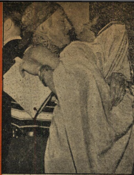
פעולת תגמול מבצע רפאל קלצ'קין עצמו, בתגובה לפלייט של אשתו עם מלך המדבר, תוקף בלהט בת'מדבר חגיגית מאד.