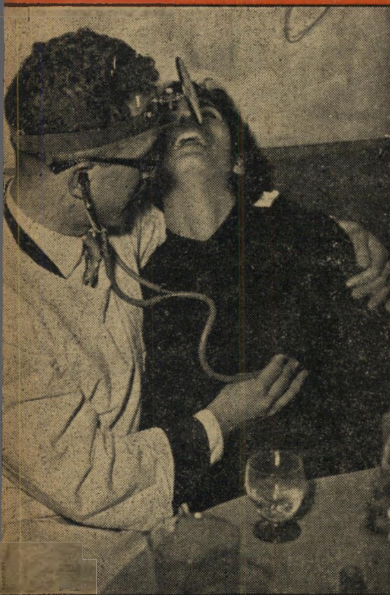
לנשום עמוק מצוה הרופא. לאחר שכוס היין שעל השולחן הורקה, אין זה משנה מה הוא בודק, העיקר שזה מדגון. היטב את הפאציניטי, המרגישה מייד הקלה רבה.