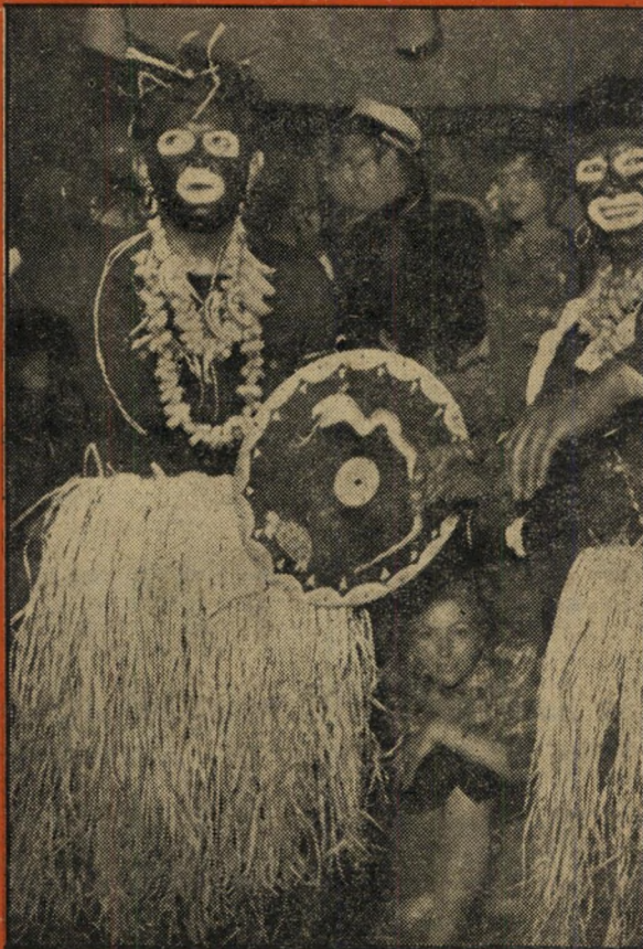
כושים שניים מרמתיים יוצאים במחול פראי מטורף, כאילו הנערה המציצה מבין רגליהם, עומדת להיות נטי רפת בארוחת הערב שלהם. הריקוד הוא ההקדמה, כנראה.