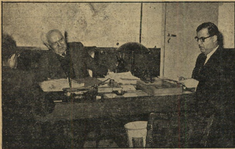
שגריר אבן כמשרד ביגיי יתכן שכן, יתכן שכן ...

של ההחלטה, שנתקבלה ברוב קולות, כש" רי אחדות העבודה ומפ"ם מתנגדים לה. האיום בפיצוץ הקואליציה הפך לגורם נכבד מאד בחישובי ביגיי. שני שרי אחדות העבודה הודיעו בפירוש כי לא יקבלו על עצמם את עול המרות הקולקטיבית, לא יצביעו בכנסת בעד שיחרור הממשלה מ" החלטת אייזנהאור של ה-23 בינואר.