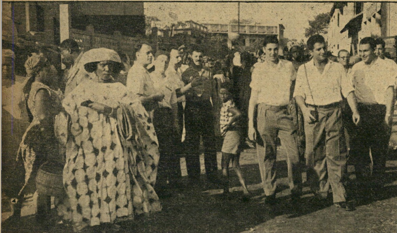
שנאה גדויה היא מנת חלקם של קבוצת מלחי מבטח אלה, הגברות הכושיות והנער במרכה, מסמלים במבטיהם העויינים את יחסם של תושבי ג'יבוטי למלחי מבטח, שלא נשאר בגדר מבטים.