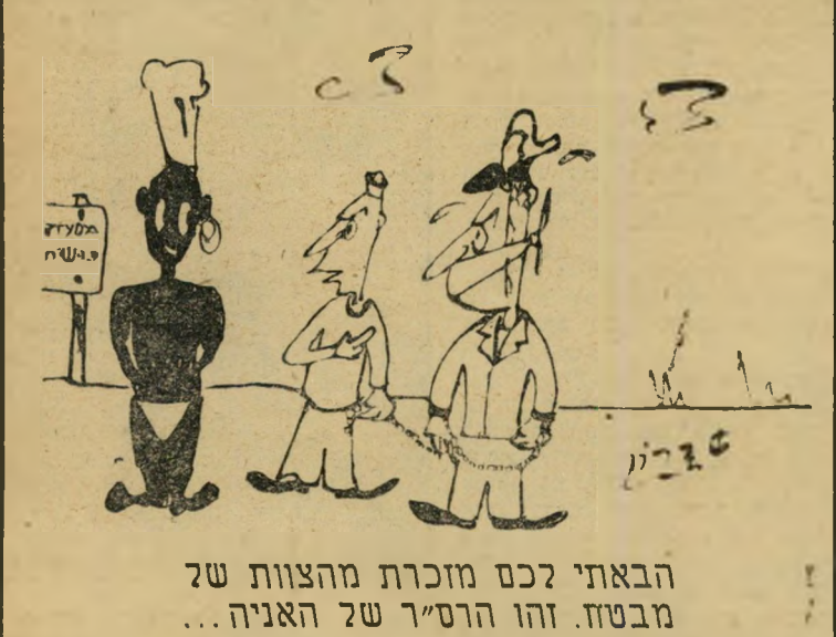
הבאתי לכם מזכרת מהצוות של מבטח. זהו הרס"ר של האניה...