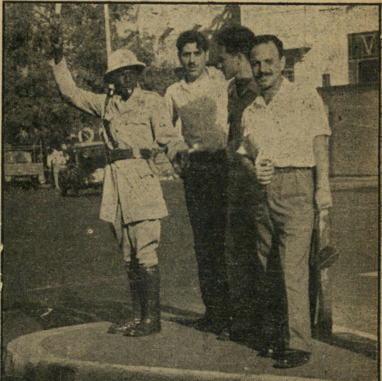
שוטר תרבותי. שלא כשוטרים יחפי הרגליים בבירה, נעול שוטר תנועה זה בג'יבוטי השומד בחברת מזחי מבטח, במנפי עוד גבוהים. זהו השוטר היחיד בג'יבוטי שלא רזף אחרי מזחי מבטח, כשניסו לצלמו. השאר התנדו בתוקף.

אנשי צד ימין של האניה, שיצאו לחופשה רק בערב, נדפקו לגמרי. הם מצאו את העיר נקיה, שלווה ומסודרת, ללא כל דמיון לעיר המלוכלכת של שעות היום. כי בשעה שבע בערב, הולכת ביירה לישון, הפועלים הכושים, העובדים בפרך מבוקר עד ערב המורת שכר