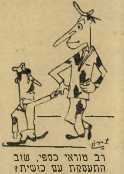
רב טוראי כספי, שוב התעסקת עם כושיית?

זעום, חוזרים לכפריהם, והעיר כמעט מתה. כל החנויות היו סגורות ואי-אפשר היה לקנות דבר. בלית ברירה, נכנסו החברה לבארים והקדימו לחזור לאניה לפני השעה שהוקצבה להם. אחד מאלה שלא וויתרו בקלות על קניית מזכרות היה רב-סמל המכונאים שלום. הוא ראה שבאתת החנויות הסגורות נמצאת אשה אחת, והחל להקיש ברוגז על חלון הראווה. להפתעת כולם נפתחה דלת החנות והופיעה מוכרת זקנה, שהומינה את רודפי המזכרות פנימה. שלום, נוסף להיותו רודף מזכרות מושבע, הוא גם חובב אידיש. על כך, לא חסך בהערות אידישיות עסיסיות על האפשרות להנדס קצת את המזכרת. לפתע, החויר כסיד. המזכרת כהתהעורר החלה לענות לו באידיש טובה משלו — אנשי הצוות גילו יהודיה נוספת, שלא היתה ידועה בקהילת העיר! לשלום לא נותרה הברירה אלא לשלם את המזכרים המפולפלים שדרשה המוכרת. הפתעה אחרת ציפתה לסגל קציני האניה, שהוזמנו לארוחה חגיגית. ההפתעה הופיעה עוד בפתיחת הארוחה: במות סרטנים וקונכייות למאכל. כולם אכלו בתיאבון מלבד הסגן, בעל קיבה יבשית טהורה.