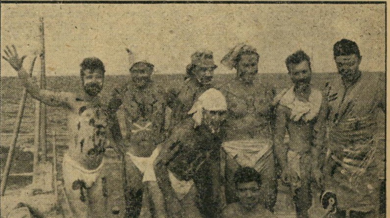
שליחיו של נפטון. אלה אינם פראים מיערות אפריקה. הם אנשי צוות מבטח, שהפכו בטקס חציית קו המשווה לשליחיו של נפטון, הממונים על עבודת ההטבילה הקדושה. הם לבושים בפיסות-בד החושפות את אחוריהם, כשכל גופם מלמעלה ועד למטה מקועקע בצבעים שונים.

היום הנך עובר בטקס רב רושם את קו הגבול המפריד בין חצי הכדור הצפוני וחצי הכדור המערבי. היום אתה חודר אל תחום ממלכת הים הדרומית המפורסמת לתהילה בגלל כרישיה, לויתניה, סערותיה וכושיה. היום אתה עובר את הטבילה המסורתית אשר תכניסך למסדר אבירי הים. מרגע עלותי על סיפון אנית חיל הים, דע לך כי אתה עומד לפקודתי