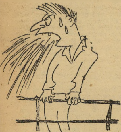
מקיא את נשמתו