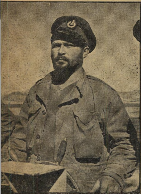
יבואי אלמוני דמות טיפוסית של איש ים.