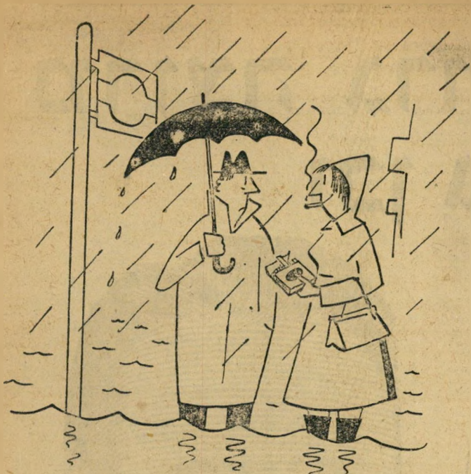
אל תתיאש - עשן "כנסת 6"

בשום מקום לא נתגלו במדינה סימנים לנכונות כזאת. בארץ נערך הויכוח על תר-ספת-השליש לשכר הפועלים, הממשלה פיר-סמה תקציב חדש שהיה כרוך בהגדלת מנ-גנונה והוצאותיה. בתנאים אלה לא היו ה-