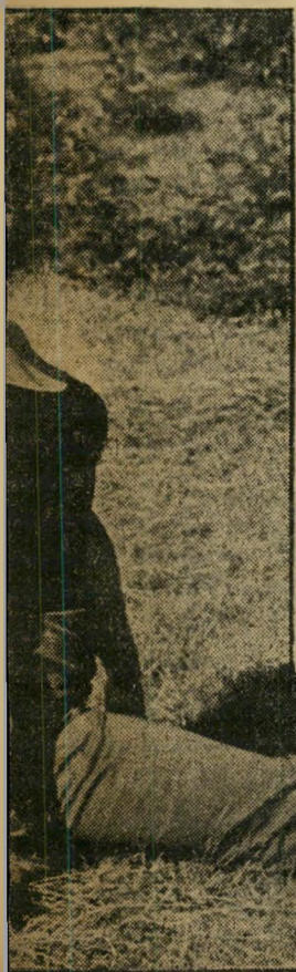
פווה שהומלצה על ידי תוכני-הפירוטומות של בריג'ט ב

בארדו (מבלי להסתכל בו אפילו): או... (נכנסת לחדר ההלבשה).