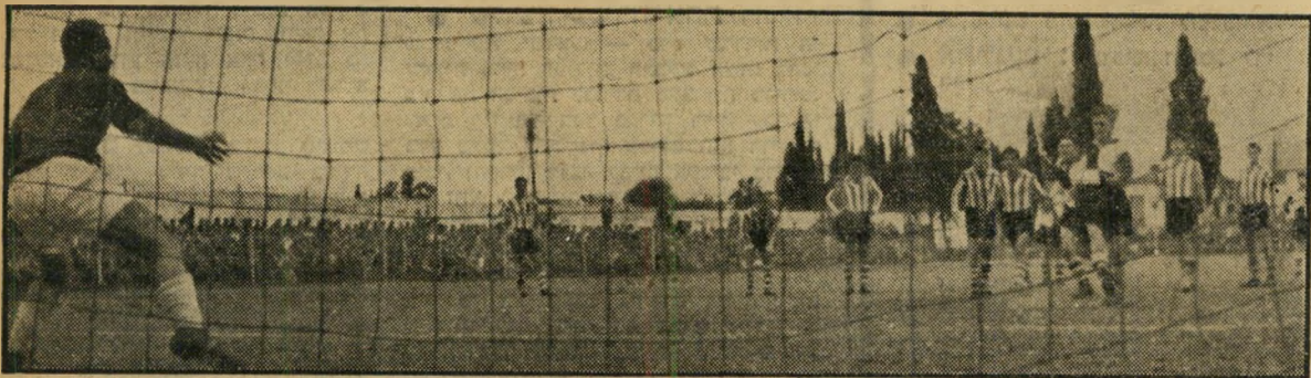
פעולת הטעיה מבצע שחקן מכבי פתח תקוה עמיחי כרמלי. תקוה יעקב ויטוקר. ויטוקר, שהוטעה, לא מנסה ככל לתפוס את כשהוא בועט את מכת 11 המטרים לשער החרק ממנו. מכבי 9:1 ניצחה בתוצאה 2:1.

חזרתי רק עכשיו מסיר קצר בעולם. בדרך חזרה מאמריקה, כשכל החברה ממכבי חזרו לארץ, עשיתי להם שלום בלונדון ואמרתי: "להתראות במכביה". זה בטח הר' גיו אותם נורא. אבל זה היה מגיע להם מפני שעוד בהונגרינג אמרו כל התברה: "אשתך לא תיסע לחוץ לארץ ואתה תחזור אימינה". התחלתי אז לשלוח טלגרמות לארץ שאני חוזר כמו שניאור, ולא נוסע לאמריקה. התחילו לעוף טלגרמות לשם ובחזרה. כל החברה רצו לראות. בסוף קיבלתי טלגרמה מפנינה אשתי, באותיות לטיניות, אבל ב' מילים עבריות: "אני נוסעת".