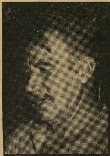
עיתונאי גורן עגול וחצפץ

הייתי מלא התפעלות כאשר הצליחה הכתבת שלכם „לסחוט“ מנושא כל כך יבש כמו תחביב פרטי (מדור אח"מ). העולם הזה