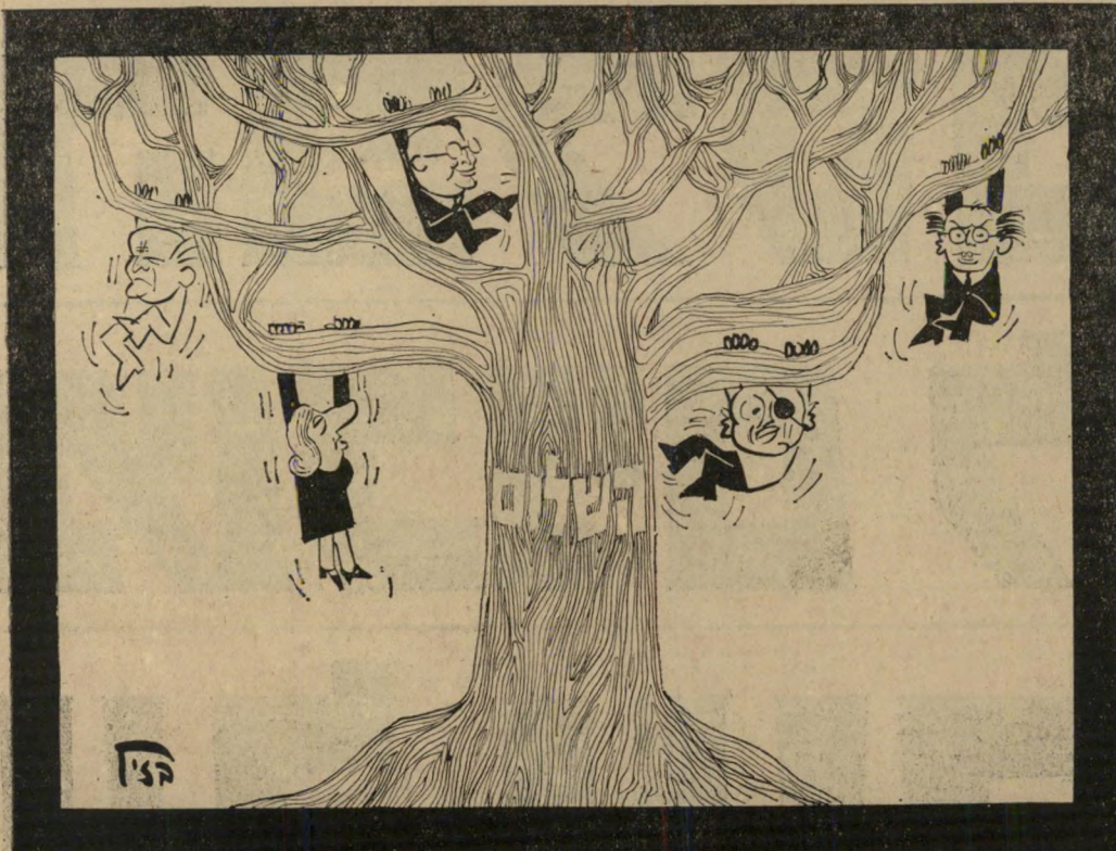
עץ חיים הוא למחזיקים בו

ביטוי לשיבוש היחסים ניתן על-ידי ביטאון אחדות העבודה, למרחב, שמתח ביקורת חריפה על הסולחה שערך יגאל אלון בין מטה הבחירות של המערך ובין מערכת הארץ. ביקורת זו נכתבה בהשראתו של גלילי, החולש על העיתון.