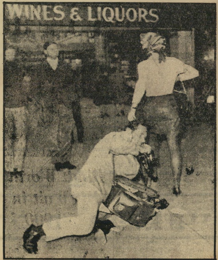
ג'קי והצלם המופל