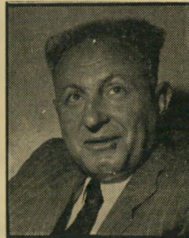
אכניאל, חרות זואר