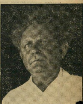
גלילי, אחה"ע חקלאות