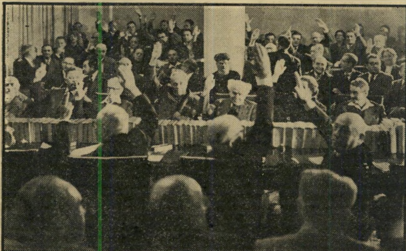
המליאה בוחרת בלזו (יושב מימין, מאחורי השולחן)