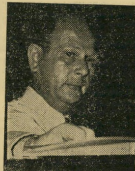
סרלין, צ"ב תחבורה