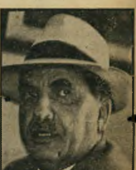
ספירא, דתי לאומי פנים