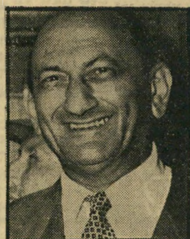
ספיר, צ"ב מסחר וזעשירה