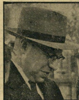
בורח, דתי לאומי בריאות