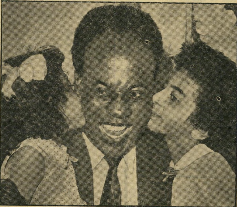
אנקרומה בקאהיר — בזכות קרובי אשתו המצרית

ישראל הצביעה בעד פיצוץ פצצת-אטום צרפתית באל-צ'חרה. בזאת התיצבה יחד עם קומץ הנציגים של כמה מדינות קולוניאליות, נגד הגוש המלוכד של כל עמי אפריקה