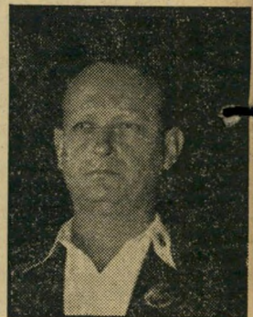
אהה, אחה"ע בטחון