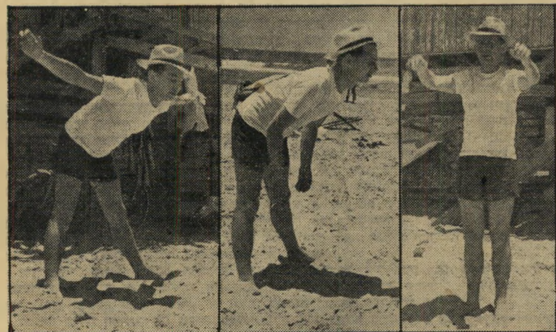
עורך שלמה טנאי ללא-יוצלה נודד, ג'וב חדש

בתקופת קיומו של רימון הועלו שלוש השערות: ● רימון ממומן על-ידי מנגנון-החושך, מתוך קרנות-בטחון סודיות, שאינן כפופות לשום ביקורת, מן הסוג המתקבל כתוצאה משיגור מטוסי-נשק מסתוריים מעבר לים. ● הכסף בא מאנשי-כסף יהודיים בחוץ-לארץ, שרומו על-ידי שליח גבוה של השלטון, שדרש מהם את הסכומים למטרות בטחוניות סודיות, השלה אותם שהמדובר ברכישת נשק. ● הכסף בא מקרנות-בטחון סודיות של מעצמה זרה, המיועדות למלחמה בקומוניזם. קרנות אלו רומו על-ידי שליחים ישראלים, שהעמידו פנים כאילו נועד השבועון למלחמה