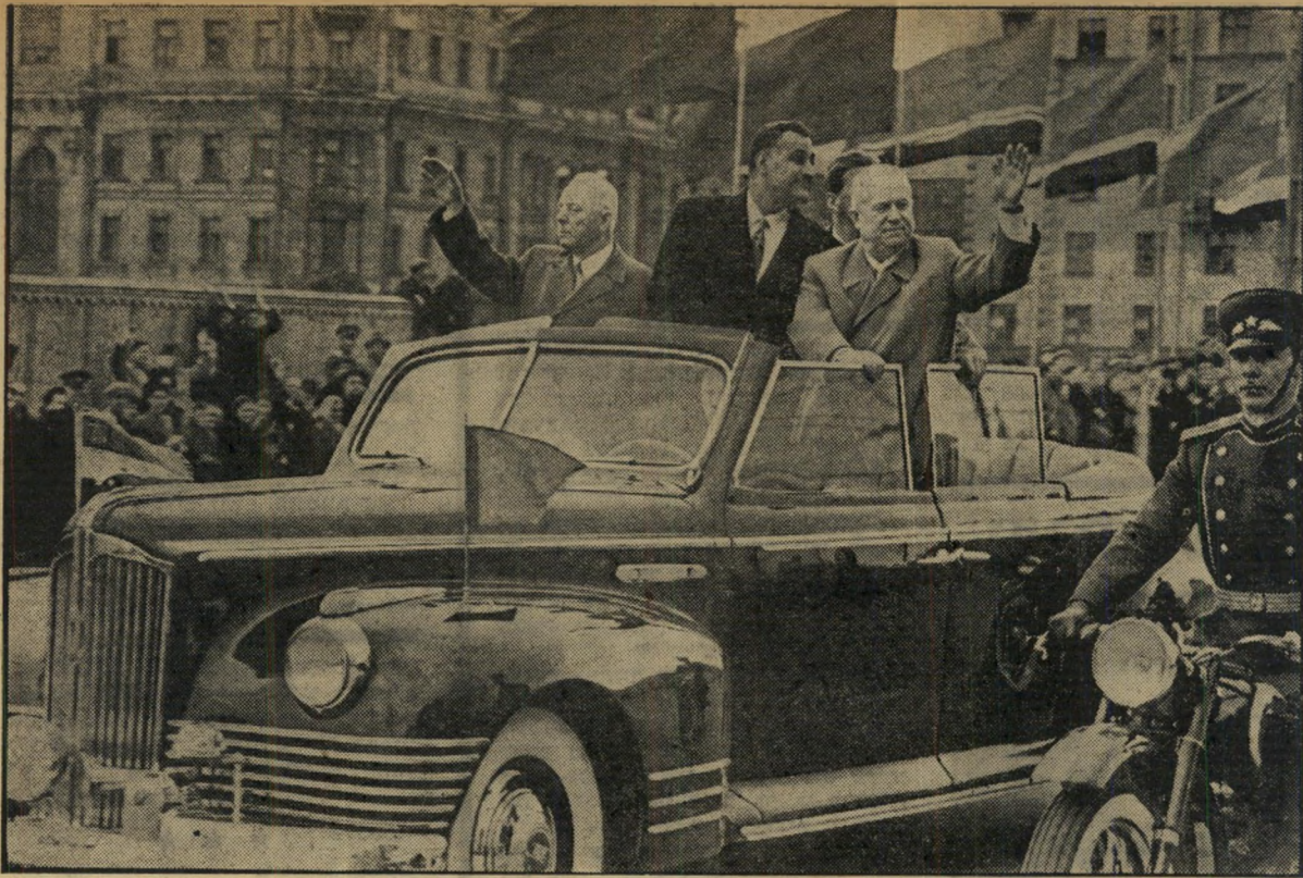
עבד אל-נאצר ומארחים ברחובות מוסקבה * כאילו לא גונה פולחן האישיות

* בגורת ישראלית אפרת של אותו מוסד היא אגרונום רחל (משק הפועלות) ינאית, הידועה כיופם ינתה בגורת טטי' ו של ה' מדינת, רעיית נשיא המדינה, רחל בן-צבי.