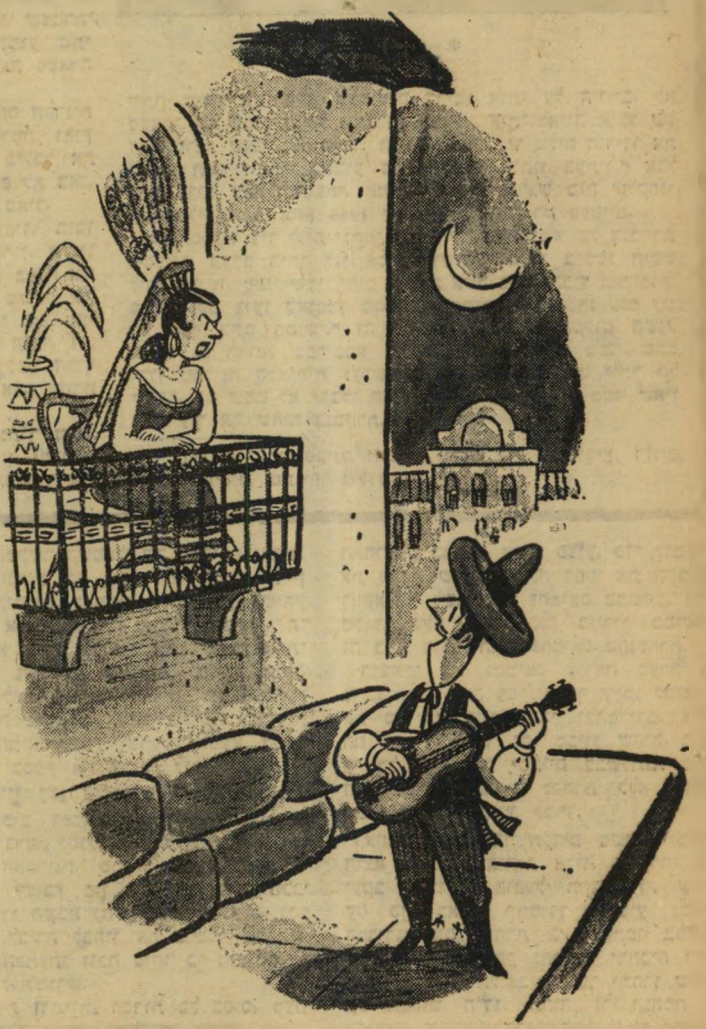
"שום סרנדה לא תעזור לך. אני לא אתן לך גט!"