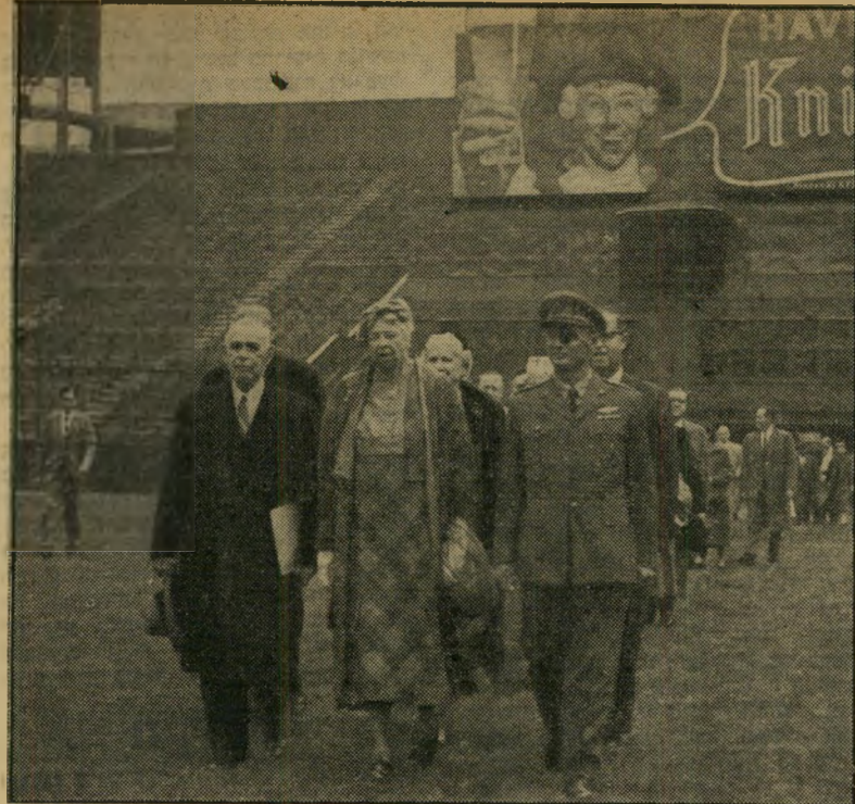
מיצער העשור בניו יורק . באיצטדיון הפולו בניו יורק, התכנסו 40 אלף איש — ברובם המכריע יהודים — לחוג את יום העצמאות העשירי של ישראל. את המיצעד פתחו תזמור רות של ארגוני משוחררי המלחמות, ארגונים ציוניים ומקהלת אוניברסיטת ברנדייס. אחריהם צעדו אורחי הכבוד. בתמונה בר'אלוף משה דיין, אלמנת הנשיא לשעבר אליאנור רוזבלט והסנאטור היהודי הרב הראש ליהמן. מאחורי דיין צועד שגריר ישראל אבא אבן.