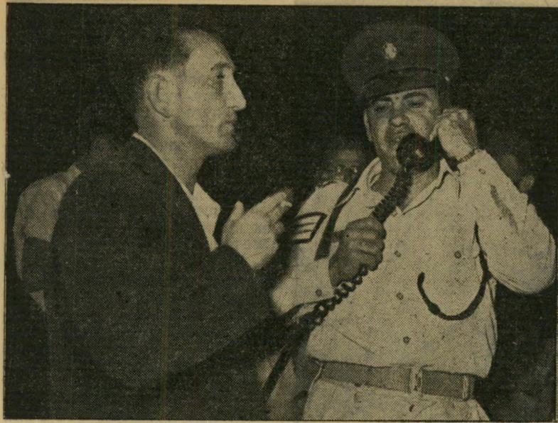
עשוראירלשעבר אגמון כליל העצמאות "אתם יכולים ללכת..."

העולמית מאיר היסגאל, שולק מכל הש"פעה בעשור כבר חודשיים לפני פתיחת שנת החגיגות, נמצא אותה שעה באחד ממסעותיו המרובים בחוף-לארץ.