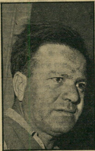
מפזמר בית-אש הפתאומיות הפתיעה

זכיון לחיפוש וניצול מקורות נפט בי-מי החוף של קוריית נמטר לחברה יפנית. כפי שגילה העולם הזה (1055) כבר לפני ארבעה וחצי חודשים, עומדים היפנים לפתח פעולות בקנה-מידה גדול בנסיונות הנמצאת בחסות בריטניה, כצעד ראשון בחזירה כל-כלית רבתי במרחב... התעוררות ה"מכונניות , שנשלחו לבית החייל באילת כמתנת בני-ברית בקנדה ונעלמו בדרך, כפי