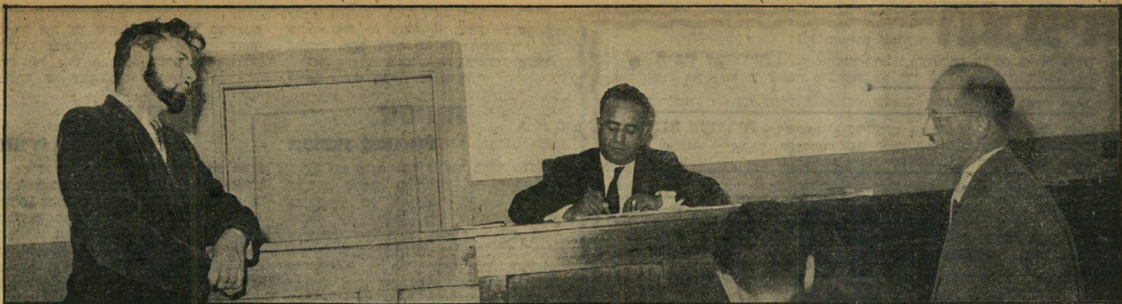
משפט חטיפת תבור: כספי חוקר את אבנרי, השופט מגוריכהן רושם פצצה במערכת, נסיון לחטוף את העורכים, מכשיר האזנה בבית קפה, פרטיכל של ישיבה סודית