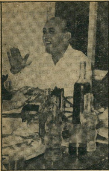
מפטר פלוטקין האולטימטום הכריע

נפש. המיוזיק-הוליס, שהיו בשעתם המקור הראשי לפזמונים הפופולריים שהופצו תוך ימים אחדים על פני הארץ כולה, לא יכלו ללמוד בהתחרות עם הבידור ההמוני החדש והזול.