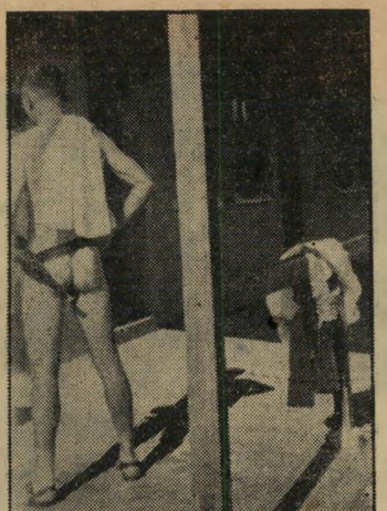
המסיים ואקרזה במקלחת (1948)