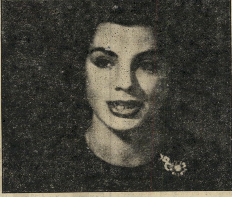
...בציוד מקרוב ליד השולחן... ...וחיוך של כוכב...