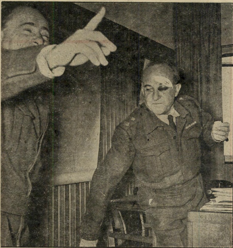
נתקף סהר במקום הפשע* במקום כניסה ב', כניסה א'

באחד ממיבצעי-השוד הגדולים ביותר, מאז רובין הוד, החליטה הממשלה סופית לכיים שתי לירות מכיסו של כל אזרח בעל