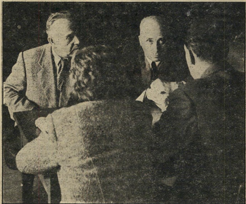
ההתייעצות בקשר עם הפצצה ב„העולם הזה” * מה, בעצם, אמר זרניצקי?

ראיתי הרבה מה נזול מראשו. ברחתי בש' ביל להודיע מה קרה.” 35 בעל הבית השכן בפי חמד עלי, „ישבנו למקום המאורע, היו פרטים נוספים.” ישבנו בחוץ ושיחקנו אלי-מגלה”, סיפר הוא.