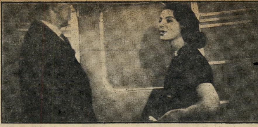
...ככניסה לקרון המסערה ברכבת... ...שני משפטים...