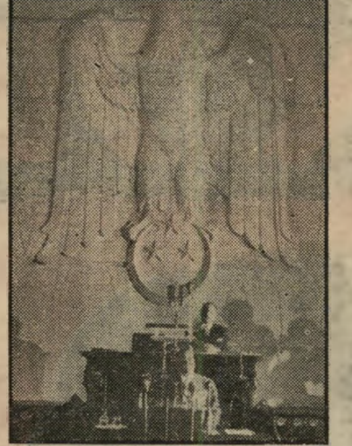
הנשר בפרלמנט המצרי

כל עוד היו אל-ערשי ועזה בירדנו, היינו יכולים להכריז על רפובליקה פלשתינאית,