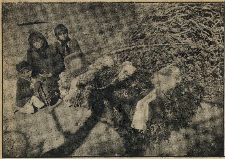
האם, האחות והאח ליד קבר הייך חסן הייך, בעצם, שדה האש?

שכל שאר הנימוקים אלו, העמיד תנאי חדש: הוא ייכנס לבית רק אחרי שיבוטל שמו הנוכחי — „המרכז הרוחני העולמי” — וייקרא הבית סתם „בית הרבנות הראשית”.