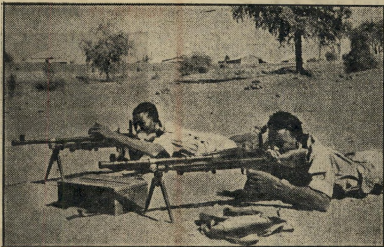
סודאים מול - שניים מחיילי הצבא הסודאני, מוכנים להפעיל מקלעי ברק. צבא זה, העומד עתה מול המצרים בוואדי חלפה, אומן וצויד עליידי מוריס אנגלים. הוא מונה 9000 איש בלבד, ללא חיל אוויר.

ה שלטון המצרי הגיע למיתה חסופה ב-1884. על הבמה הסודאנית הופיעה אחת הדמויות הסגוניות של ההיסטוריה