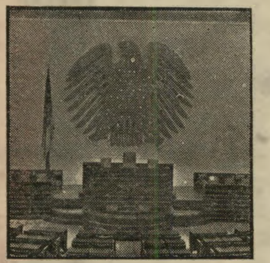
הנשר בפרלמנט הגרמני

במסגרת של איחוד פדרלי עם ישראל. זה היה יכול להיות הצעד הראשון בדרך לאיחוד מרחבי, אשר היה קם או בזכות המהפכות הישראלית — במקום לקום ב' זכות השנאה לישראל, המאחרת כיום את המרחב.