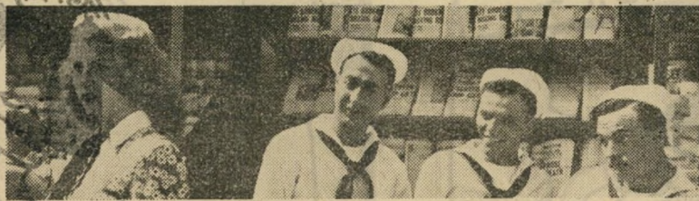
אהבת מלחים ביבשה