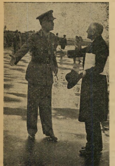
סר ברייאן רוברטסון, גנרלי המדים לא נרטבו

רוב המפלגות נמנעות מלצאת בסיסמי את אנטי-דתיות, מחשש שהבריהם הדתיים יצטרפו לחזית הדתית. בעיריית ירושלים, למשל, זכתה החזית הדתית בששה מקר כות: שאר המפלגות (מפא"י, ציונים כל-