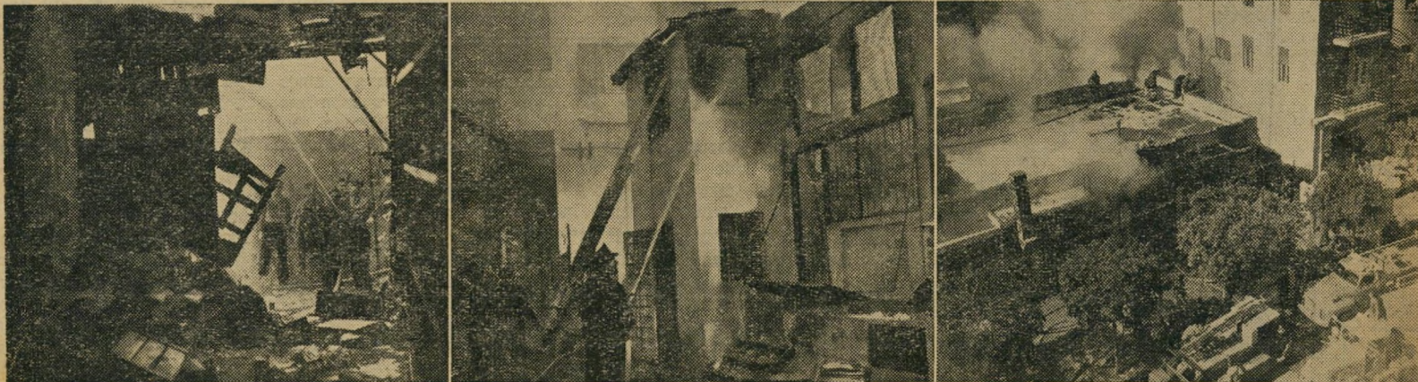
השריפה באלנבי 74: חנויות בני, מצקין וליהמן עזות באש גם לא אהבה יפאנית