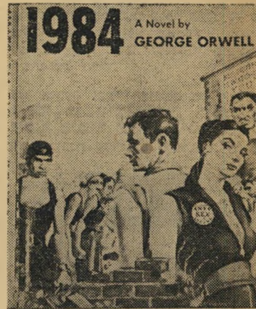
המעטפה האמריקאית של "1984" מספר 6079 ר"ח

ספרו של אורול, בריטי בן 46, שמת בשנה שעברה, אול בלונדון מן השוק תוך שעות. באמריקה נמכרו למעלה מחצי מיליון עותקים. בישראל אולה המהדורה השנייה.