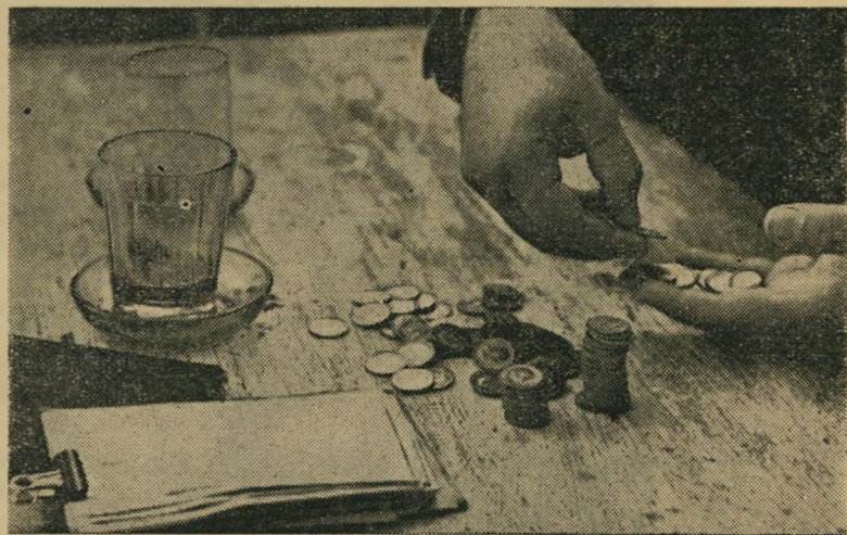
ר'ח' לייזנבלום: בורמת הוהב בפעוהה בן-גוריון לא ישרא..

בהופיעם בפני השופט ללא עורך דין, התנהל "דו קרב משפטי" מענין בין הנא-שם מספר אחד (דושינסקי-צ'קסון) ובין ה' הובע, סגן פרקליט המחוז, בנימין טומק' ביץ, שגילה בפני השופט את פרשת היי-נות, הצ'קים והמכונית. אמר ההובע טומ' קביץ: "הבאנו את האיש לפי סעיף 337" (זיוף מסמכים). קפץ הנאשם מספר אחד ממקומו וענה לעומתו: "מדוע דוק 337? אני לא מסכים! מה יש לך כדי להוכיח