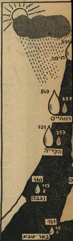
עד 13.251 בהשואה לאוי קודמת

עבראלה. זרמי האויר ממערב למזרח, ואתם לעננים. מכיוון שלא ידוע, ההבשלה הדרוש משעת הכימי, קשה מאד לקבוע