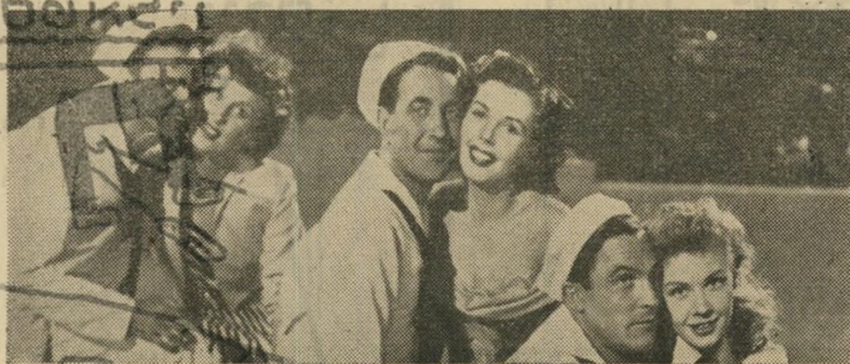
שדושת הזוגות: האפי אנד