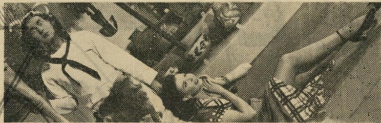
'יום אחד בניירוק': הפגישה

המעשה הוא פשוט, למש בנלי, ומזכיר במידתמה את סיפור הלכלכית: שלושה ילחים, שאיתם עיגנת בניירוק, מקבלים חופשה לעשרים וארבע שעה. אחד מהם, גייבי (ג'ין קלי) רואה את תמונתה של 'מלכת היכבבת התחתית' הנבחרת את החדש. הוא משיבניע כי היא מפורסמת ונערצת על ידי כל העיר. למעשה איננה אלא רקדנית 'מזרחית' במרכז שעשועים.