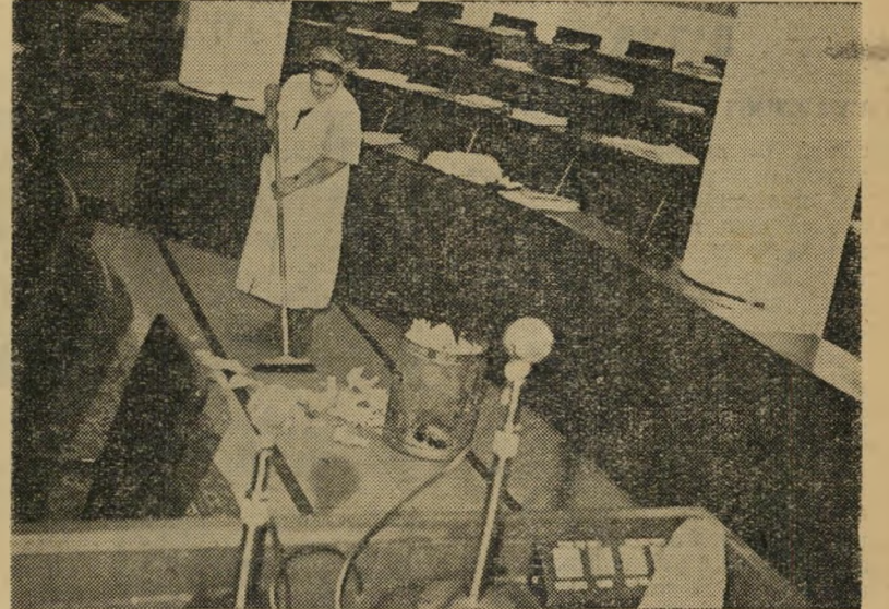
הכנסת: אחרי הישיבה, ניקוי כליי גשם של דולרים

שתי האפשרויות: ביום בו מל או שלושה חדשים בדיוק (14.11-14.2) לנצחון הציונים הכלליים, בבחירות העירוריות, נפלה ממשלה שלא יכלה להתעלם יור תר מתסיסת המון אזרחי, שכמחציתם (עולים חדשים וערבים) לא השתתפו בו