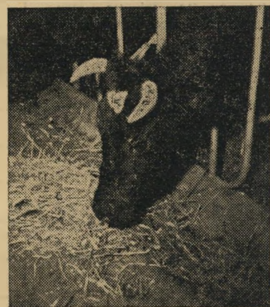
פחות אומץ — פחות חלב. תנובת הרפת תלויה בראש ובראשונה בכמות האוכל הניתן לפרות, והרכבו. אם ענף המספוא לא יתן יבול גבוה, יתבטא הדבר בירידת תנובת החלב של הפרות, וקיצוץ בתוכנית הרחבת הרפת.

גשמים בכמויות מס' פיקות כדי להציל את יבול הקיץ, או שמא יהיה גורלו כי גורל יבול החורף? אהדים היו פסימיים ביותר, חששו שמא לא יספיק היבול הניכחי גם לזרעים.