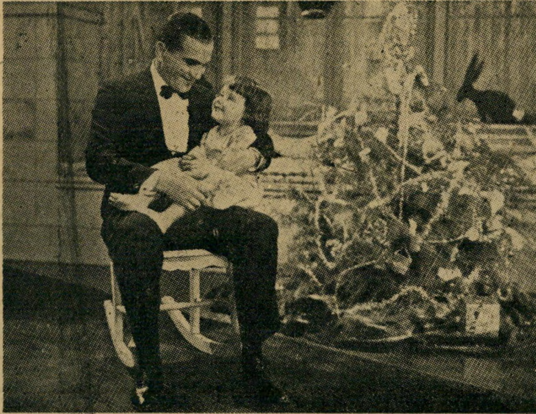
אל ג'ולסון הקהל התחשמל...

אחת מהן מעוצבת באמנות רבה ובידי שחקנים כאולגה סאן חואן, רודי וואלי, פורטר הול וסטאנלי הולוביי.