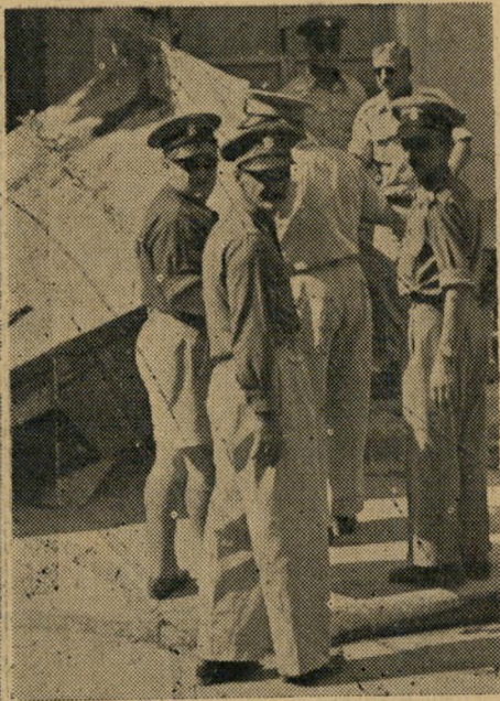
פקחי העיריה והריסות הקיומק קודם הערבים...

ולסגור לזמן-מה את מאפיות הערביניים, ולגרום להפרעות באספקת הלחם? לנהוג לפנים משורת הדין — לא יהיה לדבר סוף וסלחנותו עלולה לעודד התנהגות דומה גם להבא.