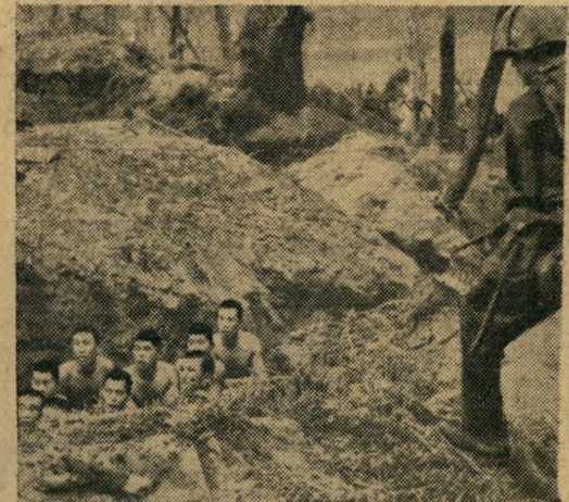
תחנות בניינים. אם יתפנה מישהו כדי לספול בשבויים הצפוניים, מה טוב — ולא...

הודות למלחמה. לפני פרוץ המלחמה, ירדה השפעתו של רי וממשלתו עמדה על סף פשיטת-רגל פוליטית. ההתנגדות גברה לא רק בקרב תושבי המדינה אלא גם בחוגי השלטון האמריקאי. עד אשר פרצה המלחמה. תהה צומד צבאו של סינגמן בגבולותיה הצפוניים של הארץ. הוא תובע לעצמו שליטה על כל הארץ כאילו הדבר מובן מאליו. כבר היום, מתיחס רי אל החלטות או"ם כאל החלטותיה של מועצת הנבחרים של דרום קוריאה. הוא "אבי עמ", הוא תובע, ועל או"ם לאפשר לו "לאחד" את הארץ. כל החלטה אחרת היא חסרת תוקף פוליטי ומוסרי בעיניו.