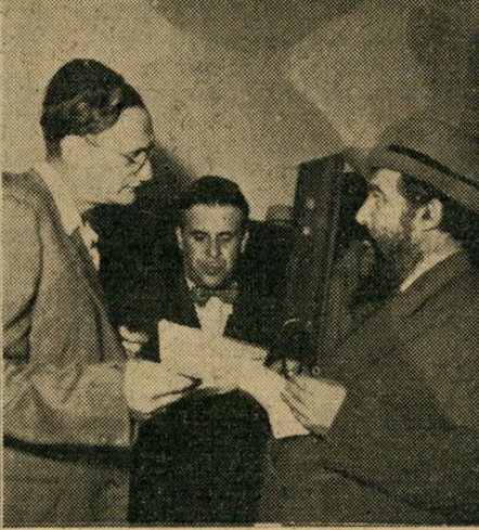
הרגע הגורלי: הדתיים מקבלים את האול" טימטוס האחרון של דוד בן-גוריון. ראש הממשלה יודע שהדתיים לא ירצו לוותר על השלטון.