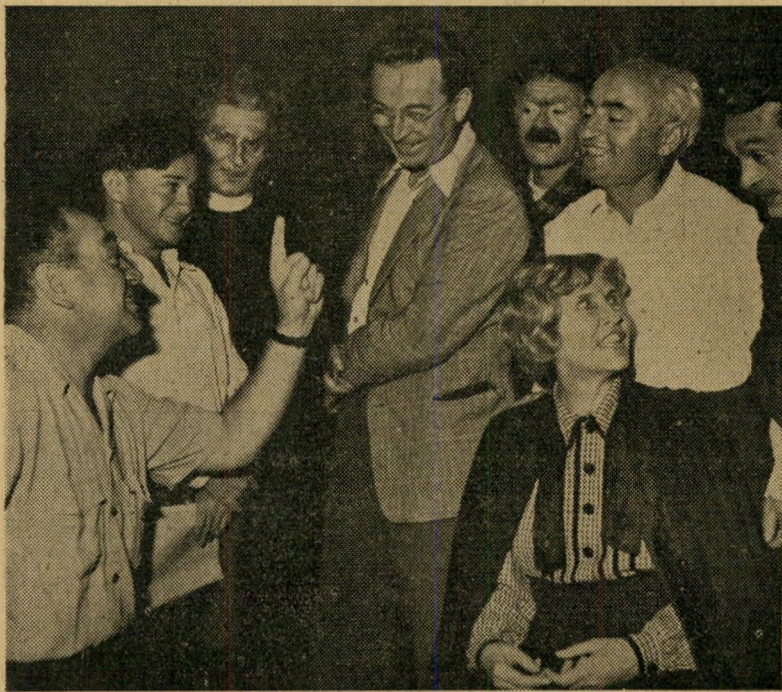
חזרה אחרונה ל"מיס מייבל" (איש לא נאם ציונות)

עד היום היו לה, הבמה" סניגורים רבים שביקשו כי יניחו לה להציג מחזות כבדים מפני שאין ביכלתה להציג מחזה משעשע ומרתק. עתה הוכיחה כי היא יכולה גם אחרת, ואין לה עוד תירוץ לחזור לשיגרתה. אלא שבכל זאת הייתה לה נקיטת מצפון על הפרה זו של מסורת מקודשת, ולכן כתבה בתכנית הקדמה ארוכה הבאה להס" ביר את משמעותו הפילוסופית, האיטית והתיאולוגית של מחזה זה. לו רצא ר. ס.