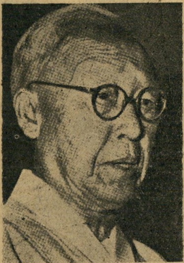
סינגמן רי המחיר: 300.000 דולר

גם כן איש פשוט. עם כיבוש קו-ריאה, שיכנע סינגמן רי את האמריקאים להרשות לו לחזור לקוריאה "כאיש פשוט". אולם כאשר הגיע לסיאול, נתקבל בהתלה-בות רבה, והחל מארגן מפלגה חזקה מש-לו, "שאינה שייכת לשום מפלגה אחרת". דבר זה נתקבל באהדה על ידי התושבים