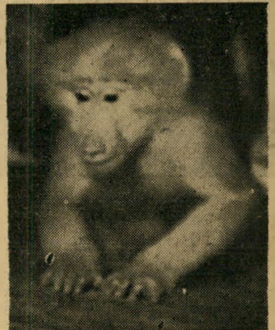
הקוף ג'וניג'י — דבר אחד חסר בפתקיו...

ג'וני הוקף הביתה הכל הלך לימישנים, עד אשר הגיע המטוס לשמי סעודיה, והגביה טוס. הקופים שלא היו רגילים