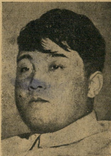
קים-איל-סונג המחיר: 100.000 דולר

מאחורי מלחמת הגרילה הזאת עומד אותו איש שעמד מאחורי הצבא הצפוני בהתקדמות הבזק לאורך כל קוריאה הדרו-מית כמעט. זהו קים-איל-סונג, או קים-איר-סון, כפי שנקרא בפי הרוסיים, נמוך, שמי, וממונמם.