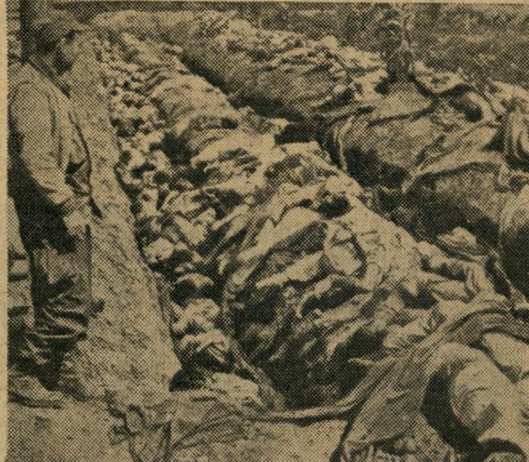
תוצרת קומוניסטית. עם כיבוש טייג'ון בידי האמריקאים נתגלו 400 גויות של דרומיים.